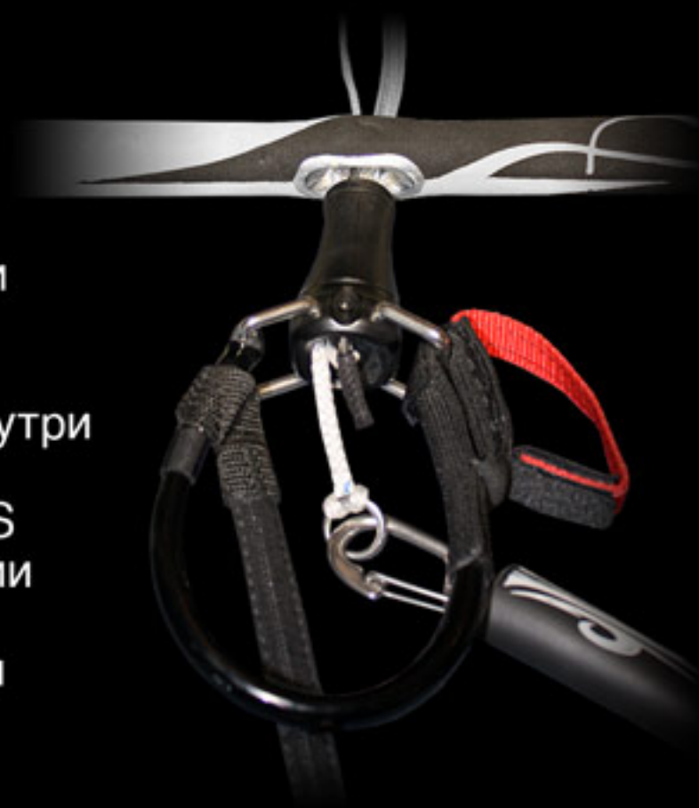
Стропы: схема подключения